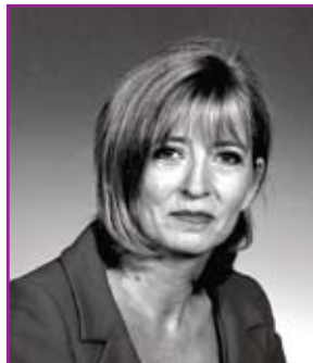
Emily O'Reilly Ombudsman