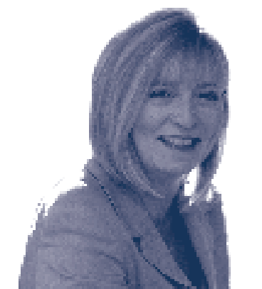
Emily O'Reilly Ombudsman