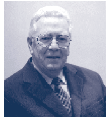
Liam Kavanagh Iar Bhall de Dháil Éireann